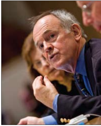
M. Darnton-Hill de l'UNICEF s'exprime sur la faim chez les enfants lors de la Journée du Rotary International à l'ONU en 2008.

besoin de recevoir un traitement très rapidement », dit-elle.